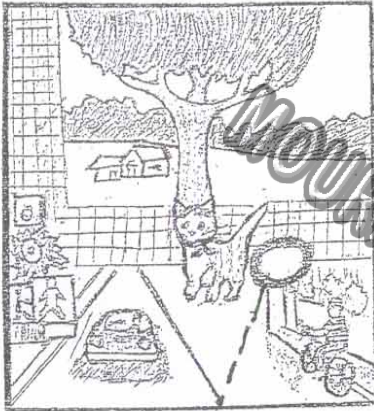
Le trou sous le grillage