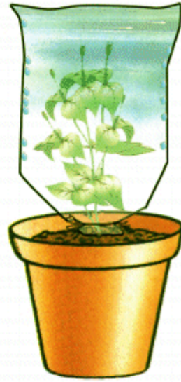
النبتة بأوراقها أصيص أ