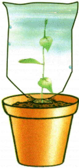
النبتة دون أوراق أصيص ب

إذا أخذنا نبتتين، وقمنا بتغليف كل واحد منهما بكيس من البلاستيك، النبتة الأولى مورقة ومغروسة في الأصيص (أ)، والثانية مجردة من أغلب أوراقها ومغروسة في الأصيص (ب)؛ نلاحظ بعد فترة زمنية أن الكيس في الأصيص (أ) يحتوي على عدد كبير من قطرات الماء على سطحه الداخلي يفوق ما هو موجود في الكيس الثاني (انظر الصورة). فنستنتج أن النبتة بعد أن امتصت الماء بواسطة جذورها، تطرح جزء منه - على شكل بخار الماء - نتيجة عملية التبخر، والتي تتم على مستوى الأوراق.