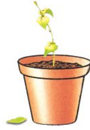
أصيص عدد 1 تريب دون سقي