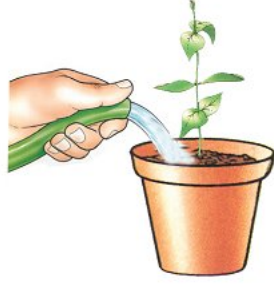
أصيص عدد 2 تريب مع سقي منتظم

إذا زرنا نبتة في أصيص ( 1 ) به تريب جاف دون سقي وقمنا بزرع نفس النبتة في أصيص ثان ( 2 ) به تريب جاف مع سقي منتظم. (انظر الصورة). نلاحظ بعد أيام أن النبتة في الأصيص ( 1 ) تذبل وتموت، أما التي في الأصيص ( 2 ) فتبقى على قيد الحياة وتنمو بطريقة عادية. فنستنتج أن الماء ضروري لنمو النبتة.