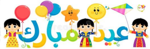
الاحتفال بعيد الفطر والأضحى