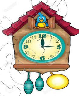
دوران عقارب الساعة