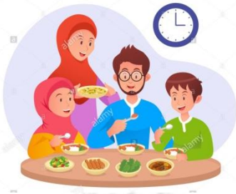
صيام شهر رمضان

هي أحداث تتكرر بصفة منتظمة ( كل ثانية، كل ساعة، كل يوم، كل شهر، كل سنة ) . مثال: