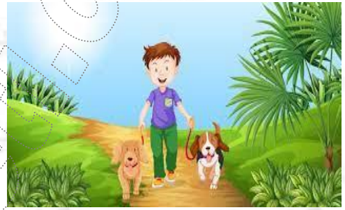
الخروج في نزهة