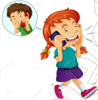
التحدث عبر الهاتف