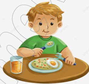
تناول فطور الصباح